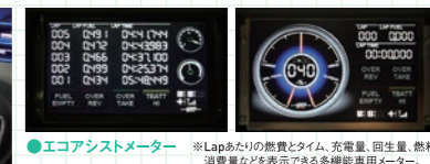
●エコアシストメーター ※Lapあたりの燃費とタイム、充電量、回生量、燃料消費量などを表示できる多機能専用メーター。